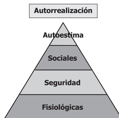
(Pirámide de la Teoría de las Necesidades)

Abraham Maslow 26 en su teoría de la motivación y de la personalidad humana señala: "La presente teoría se debe considerar como un programa indicativo para ulteriores investigaciones y debe sustentarse, o desmoronarse, no tanto a partir de los hechos conocidos o las evidencias presentadas, como desde las investigaciones que quedan por hacer".